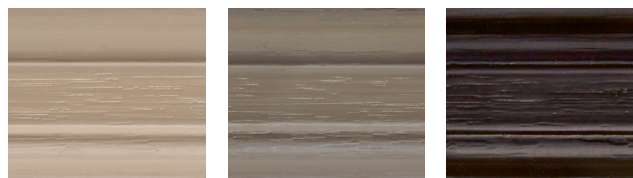
graubeige (RAL 1019)