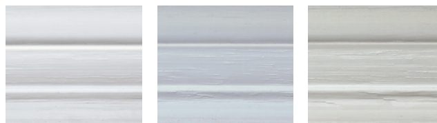
verkehrsweiß (RAL 9016)